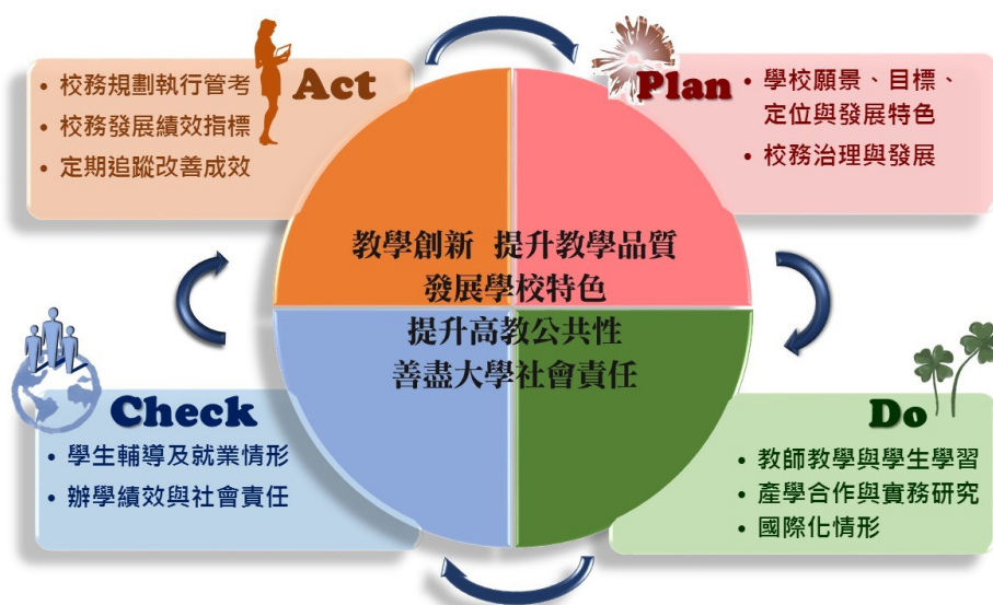
本校校務發展 PDCA 機制圖

本校在行政組織再造、教師專業增能、學生深化學習、課程實務創新、產學資源整合、優化校園設備、關懷社會扶助弱勢等面向上持續精進，以期永續發展，包括院系的整合與規劃、單位的行政業務調整、輔導系統的精進、產業鏈結能量的提升等。校務發展計畫根據 PDCA 機制，導入高教深耕計畫指標與精神，聚焦於教學創新落實及教學品質提升、積極發展學校特色、提升高教公共性及善盡大學社會責任等四面向，強力展現嶄新科技大學新氣象。