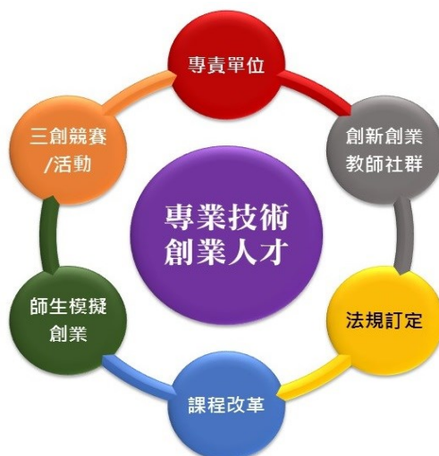
本校培育專業技術創業人才之因應策略

瞭解團隊的困難及需求，並適時安排企業經理人、校友、會計師到校輔導，引入企業及校友資源，積極協助經營團隊解決創業上遇到之問題。